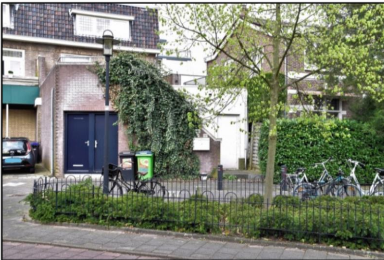
Uitbreiding van de winkel op de Slotlaan in de tuin van mevrouw Van Loon

De zaak blijft verdrietig maar er iets zinvols mee gedaan. Als mevrouw Van Loon in 1991 goed behandeld was, was de Buurtvereniging Wilhelminapark dat jaar niet opgericht. Misschien was de Buurtvereniging dan later opgericht bij een ander conflict, maar niet op 6 april 1992. Wat gebeurde er in 1991? De heer en mevrouw Van Loon hadden destijds hun huizen Huydecoperweg 1 en 3 verkocht aan een bedrijf op de Slotlaan.